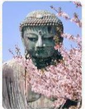
พระใหญ่ไดบุทสึ วัดโคโตคุอิน

จุดเด่นแห่งเมืองนี้คือ พระพุทธรูปองค์ใหญ่ไดบุทสึ (Daibutsu) หนึ่งในสัญลักษณ์ที่โดดเด่นที่สุดของ Kamakura พระพุทธรูปบรอนซ์ขนาดมหึมาที่วัดโคโตคุอิน (Kotoku-in) ที่มีความสูง 13.35 เมตร หนึ่งในพระพุทธรูปที่ใหญ่ที่สุดในญี่ปุ่น ไฮไลท์ของที่นี่คือการได้ชมความงามที่ตัดกันระหว่างพระพุทธรูปไดบุทสึขนาดใหญ่และต้นซากุระ ซึ่งปลูกอยู่ทั้งด้านหน้าและด้านหลังของพระพุทธรูป ทำให้เหมาะอย่างยิ่งกับการเดินเล่นและชมซากุระในบริเวณวัด เป็นอีกหนึ่งสถานที่ที่ต้องมาเยือนสักครั้ง หนึ่งในจุดไฮไลท์ของเมืองคามาคุระ คือ ไมโกลกันพาเอียน เกาะเอโนะชิมะ (Enoshima) เป็นเกาะที่ตั้งอยู่ในจังหวัดคานากาวะ ประเทศญี่ปุ่น ซึ่งเป็นจุดหมายท่องเที่ยวยอดนิยมที่มีทิวทัศน์สวยงามและสถานที่ที่น่าสนใจมากมาย ทั้งชายหาด สวน และวิวทะเลที่งดงาม ในวันที่ท้องฟ้าโปร่งใสเรายังสามารถมองเห็นวิวของภูเขาไฟฟูจิได้อีกด้วย ด้านบนยังมี ศาลเจ้าเอโนะชิมะ ที่มีความสำคัญในด้านความโชคดี โดยเฉพาะในเรื่องความรัก นอกจากนี้ยังมี หอคอยประกาศการเอโนะชิมะ ที่ให้ทัศนียภาพ 360 องศา ของเมืองคามาคุระได้อีกด้วย