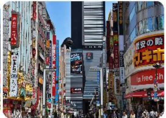
ช้อปปิ้งใจกลางกรุงโตเกียว - ซินจูกุ

นำพาทุกท่านเข้าสู่.. กรุงโตเกียว แวะช้อปปิ้งกันที่ใจกลางเมือง ซินจูกุ แหล่งรวมแฟชั่นและความบันเทิงย่านที่ไม่เคยหลับไหลและเต็มไปด้วยชีวิตชีวา และแหล่งช้อปปิ้งที่หลากหลาย เช่น Isetan และ Takashimaya ที่มีสินค้าหรูหราและแฟชั่นล่าสุด รวมถึงห้างสรรพสินค้าในตึกสูงอย่าง Tokyo Metropolitan Building เพลิดเพลินกับบรรยากาศที่สวยงามของ Kabukicho ซึ่งเป็นย่านบันเทิงที่มีร้านอาหารมากมาย นอกจากนี้ยังมี Golden Gai ซึ่งเป็นย่านบาร์เล็กๆ ที่มีเสน่ห์และบรรยากาศที่เป็นเอกลักษณ์ และมีแลนด์มาร์คถ่ายรูปที่โด่งดังอย่าง แมวยักษ์ 3 มิติ (Giant 3D Cat)