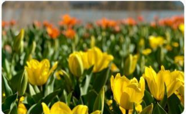
สวนโออิชิ ปาร์ค

สวนดอกไม้โออิชิ ปาร์ค (Oishi Park) มหัตศรรย์แห่งวิวกุเขาไฟฟูจิ หนึ่งในจุดชมวิวกของภูเขาไฟฟูจิที่สวยงามที่สุดอีกจุดหนึ่ง ที่จะเติมเต็มความสงบและความงดงามของธรรมชาติในญี่ปุ่นเมื่อไปเยือน คือสถานที่ที่ไม่ควรพลาด สวนดอกไม้โออิชิ ปาร์ค (Oishi Park) แห่งนี้ไม่ได้เป็นเพียงสถานที่ที่มีดอกไม้สวยงามให้เราได้ชื่นชมแล้ว จุดเด่นของสวนนี้คือวิวกุเขาฟูจิที่อยู่เบื้องหลังสวนดอกไม้สีสันสดใส ที่บานสะพรั่งในทุกฤดูกาล และยังเป็นมุมที่ให้เราได้สัมผัสกับวิวกุเขาฟูจิได้อย่างใกล้ชิด จากนั้นนำพาทุกท่านสู่..