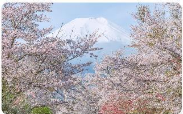
หมู่บ้านน้ำใสโอชิโนะ ฮักโก

โอชิโนะ ฮักโก หรือ ที่รู้จักกันในชื่อ หมู่บ้านน้ำใส ความงามแห่งธรรมชาติและวัฒนธรรมที่ซ่อนอยู่ใต้เงาภูเขาไฟฟูจิโอชิโนะ ฮักโก ตั้งอยู่ในหมู่บ้านโอชิโนะ จังหวัดยามานาชิ ประเทศญี่ปุ่น เป็นแหล่งน้ำธรรมชาติที่มีชื่อเสียง ประกอบด้วยบ่อน้ำใสสะอาดทั้งแปดแห่ง ซึ่งน้ำในบ่อเหล่านี้เกิดจากการละลายของหิมะและน้ำแข็งจากภูเขาไฟฟูจิ น้ำที่ไหลลงมานั้นได้ถูกกรองผ่านชั้นหินภูเขาไฟเป็นเวลาหลายปี จนทำให้