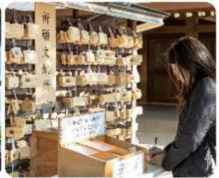
ศาลเจ้าเมจิจิงกู

ศาลเจ้าเมจิ หนึ่งในสถานที่อันศักดิ์สิทธิ์ใจกลางกรุงโตเกียว สิ่งแรกที่จะทำให้คุณประทับใจคือการเดินผ่านเสาโทริอิขนาดใหญ่ ระหว่างทางมีธรรมชาติที่ทำให้รู้สึกเหมือนก้าวเข้าสู่โลกหนึ่งใหม่ที่เต็มไปด้วยความสงบ อีกทั้งยังสามารถเขียนคำอธิษฐานลงบนแผ่นไม้ "เอมะ" เพื่อขอพรสำหรับความสุขและความสำเร็จในชีวิตอีกด้วย จากนั้นนำพาทุกท่าน...ซ้อปปิ้งกันต่อใจกลางกรุงโตเกียว เมืองที่เป็นศูนย์กลางของแฟชั่นและนวัตกรรม และเปิดประสบการณ์การช้อปปิ้งที่ไม่เหมือนใคร! สัรวจย่านต่างๆ ที่แต่ละแห่งที่มีเสน่ห์และเอกลักษณ์อันโดดเด่น เมืองที่เต็มไปด้วยชีวิตชีวาและความทันสมัยที่หลากหลายอย่าง ย่านฮาราจุกุ แหล่งรวมแฟชั่นที่แปลกใหม่และสดใส เดินเล่นบน Takeshita Street ที่เต็มไปด้วยเสื้อผ้าและเครื่องประดับที่ไม่ซ้ำใคร เพลิดเพลินกับบรรยากาศสุดคูลที่เป็นเอกลักษณ์