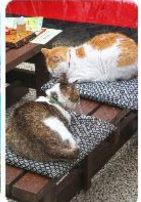
เกาะเอโนะชิมะ

เมืองคามาคุระ (Kamakura) เมืองน่ารักติดทะเล ตบโจทย์ที่เกี่ยวที่ผสมผสานระหว่างประวัติศาสตร์ ธรรมชาติ และความงามของทะเล บอกเลยใครมาต้องตกหลุมรักกับเมืองสุดชิล อย่าง คามาคุระ เมืองเล็กๆ ที่ตั้งอยู่ทางตอนใต้ของจังหวัดคานากาวะ ห่างจากโตเกียวเพียงแค่ 1 ชั่วโมง เท่านั้น แต่เต็มไปด้วยสถานที่ท่องเที่ยว ทิวทัศน์ธรรมชาติ และชายหาดที่งดงาม ที่นี่จะทำให้ทุกคนรู้สึกเหมือนได้ย้อนกลับไปสัมผัสประวัติศาสตร์ญี่ปุ่นในยุคซามูไร พร้อมทั้งได้ผ่อนคลายท่ามกลางบรรยากาศที่เงียบสงบและสดชื่น