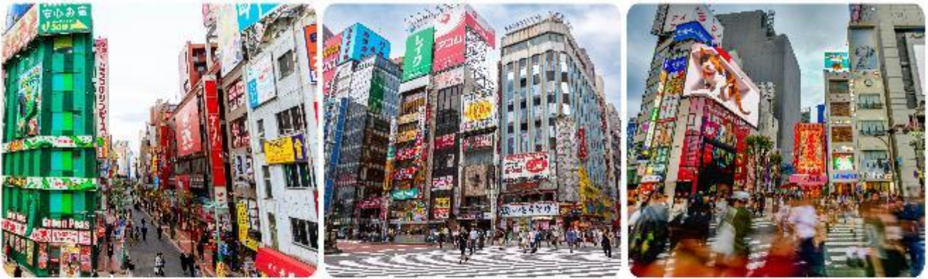
ช้อปปิ้งใจกลางกรุงโตเกียว - ซินจูกุ

มื้อกลางวัน บริการท่านด้วย บุคอาหารญี่ปุ่นเบนโตะ