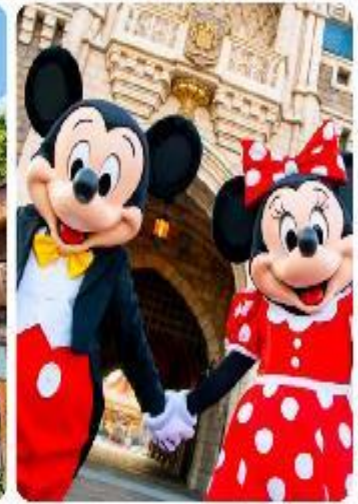
โตเกียวดิสนีย์แลนด์

แนะนำที่เที่ยว อิสระด้วยตัวเองเต็มวัน ! เลือกซื้อทัวร์เสริมอิสระดิสนีย์แลนด์ (ไม่มีหัวหน้าทัวร์และไม่มีไกด์นำเที่ยว) เอาใจแฟนพันธุ์แท้ของดิสนีย์ กับ สวนสนุกโตเกียวดิสนีย์แลนด์ ที่เต็มไปด้วยการผจญภัย ความสนุกสนานในโลกแฟนตาซีเมื่อเดินทางเข้าสู่ สวนสนุกโตเกียวดิสนีย์แลนด์ จะพบกับธีมพาร์คที่ แบ่งออกเป็น หลากหลาย เช่น Adventureland ที่เต็มไปด้วยการผจญภัยในป่าและน้ำตก, Fantasyland ดินแดนของตัวละครดิสนีย์ที่คุณหลงใหล, และ Tomorrowland ที่จะพาคุณไปสำรวจอนาคตที่เต็มไปด้วยนวัตกรรม และเปิดประสบการณ์ใหม่ที่ Tokyo Disney Sea ที่จะพาคุณไปผจญภัยยังโลกทะเลและการผจญภัยทางน้ำ นอกจากนี้เรายังเพลิดเพลินกับร้านอาหารและคาเฟ่รวมถึงของฝากจากดิสนีย์ อีกมากมาย (ค่าทัวร์ยังไม่รวมบัตรค่าเข้า)