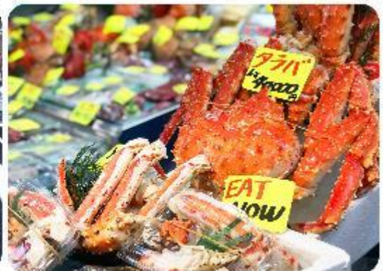
ตลาดปลาซึกิจิ