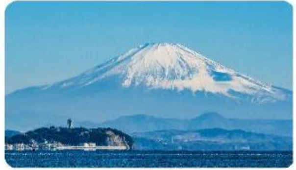
เกาะเอโนะชิมะ

เมืองคามาคุระ (Kamakura) เมืองน่ารักติดทะเล ตบโจทย์ที่เที่ยวที่ผสมผสานระหว่างประวัติศาสตร์ ธรรมชาติ และความงามของทะเล บอกเลยใครมาต้องตกหลุมรักกับเมืองสุดชิล อย่าง คามาคุระ เมืองเล็ก ๆ ที่ตั้งอยู่ทางตอนใต้ของจังหวัดคานากาวะ ห่างจากโตเกียวเพียงแค่ 1 ชั่วโมง เท่านั้น แต่เต็มไปด้วยสถานที่ท่องเที่ยว ทิวทัศน์ธรรมชาติ และชายหาดที่งดงาม ที่นี่จะทำให้ทุกคนรู้สึกเหมือนได้ย้อนกลับไปสัมผัสประวัติศาสตร์ญี่ปุ่นในยุคซามูไร พร้อมทั้งได้ผ่อนคลายท่ามกลางบรรยากาศที่เงียบสงบและสดชื่น จุดเด่นแห่งเมืองนี้คือ พระพุทธรูปองค์ใหญ่ไดบุทสึ (Daibutsu) หนึ่งในสัญลักษณ์ที่โดดเด่นที่สุดของ