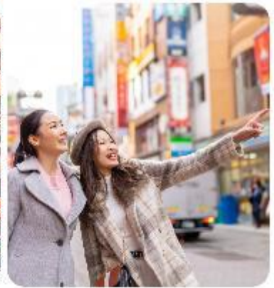
ช้อปปิ้งใจกลางกรุงโตเกียว