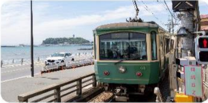
เมืองคามาคุระ