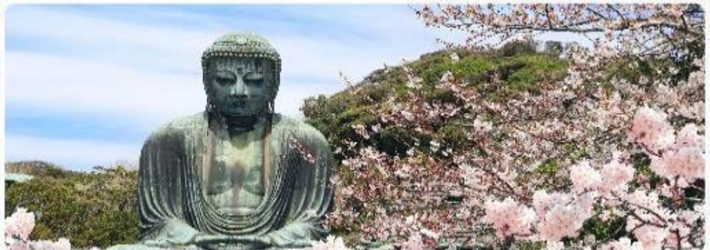
พระใหญ่ไดบุทสึ วัดโคโตคุอิน

Kamakura พระพุทธรูปbronzeขนาดมหึมาที่วัดโคโตคุอิน (Kotoku-in) ที่มีความสูง 13.35 เมตร หนึ่งในพระพุทธรูปที่ใหญ่ที่สุดในญี่ปุ่น ไฮไลท์ของที่นี่คือการได้ชมความงามที่ตัดกันระหว่างพระพุทธรูปไดบุทสึขนาดใหญ่และต้นซากุระซึ่งปลูกอยู่ทั้งด้านหน้าและด้านหลังของพระพุทธรูป ทำให้เหมาะอย่างยิ่งกับการเดินเล่นและชมซากุระในบริเวณวัด เป็นอีกหนึ่งสถานที่ที่ต้องมาเยือนสักครั้ง หนึ่งในจุดไฮไลท์ของเมืองคามาคุระ คือ ไม้ไกลกันพาเยือน เกาะเอโนชิมะ (Enoshima) เป็นเกาะที่ตั้งอยู่ในจังหวัดคานากาวะ ประเทศญี่ปุ่น ซึ่งเป็นจุดหมายท่องเที่ยวยอดนิยมที่มีทิวทัศน์สวยงามและสถานที่ที่น่าสนใจมากมาย ทั้งชายหาด สวน และวิวทะเลที่งดงาม ในวันที่ท้องฟ้าโปร่งใสเรายังสามารถมองเห็นวิวของภูเขาไฟฟูจิได้อีกด้วย ด้านบนยังมี ศาลเจ้าเอโนชิมะ ที่มีความสำคัญในด้านความโชคดี โดยเฉพาะในเรื่องความรัก นอกจากนี้ยังมี หอคอยประภาคารเอโนชิมะ ที่ให้ทัศนียภาพ 360 องศา ของเมืองคามาคุระได้อีกด้วย