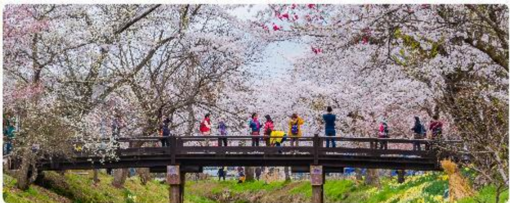
หมู่บ้านน้ำใสโอชิโนะ ฮักโก

โอชิโนะ ฮักโก หรือ ที่รู้จักกันในชื่อ หมู่บ้านน้ำใส ความงามแห่งธรรมชาติและวัฒนธรรมที่ซ่อนอยู่ใต้เงากุเขาไฟฟูจิโอชิโนะ ฮักโก ตั้งอยู่ในหมู่บ้านโอชิโนะ จังหวัดยามานาชิ ประเทศญี่ปุ่น เป็นแหล่งน้ำธรรมชาติที่มีชื่อเสียง ประกอบด้วยบ่อน้ำใสสะอาดทั้งแปดแห่ง ซึ่งน้ำในบ่อเหล่านี้เกิดจากการละลายของ