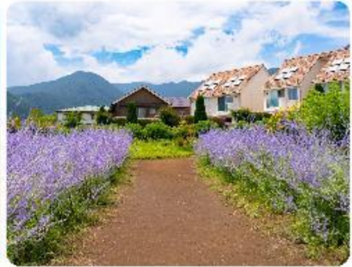
สวนโออิชิ ปาร์ค

สวนดอกไม้โออิชิ พาร์ค (Oishi Park) มหัตศจรรย์แห่งวิวกุเขาไฟฟูจิ หนึ่งในจุดชมวิวของภูเขาไฟฟูจิที่สวยงามที่สุดอีกจุดหนึ่ง ที่จะเติมเต็มความสงบและความงดงามของธรรมชาติในญี่ปุ่นเมื่อไปเยือน คือสถานที่ที่ไม่ควรพลาด สวนดอกไม้โออิชิ พาร์ค (Oishi Park) แห่งนี้ไม่ได้เป็นเพียงสถานที่ที่มีดอกไม้สวยงามให้เราได้ชื่นชมแล้ว จุดเด่นของสวนนี้คือวิวกุเขาฟูจิที่อยู่เบื้องหลังสวนดอกไม้สีแสนสดใส ที่บานสะพรั่งในทุกฤดูกาล และยังเป็นมุมที่ให้เราได้สัมผัสกับวิวกุเขาฟูจิได้อย่างใกล้ชิด จากนั้นนำพาทุกท่านสู่..