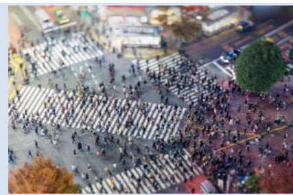
ย่านชิบูย่า — แหล่งรวมวัยรุ่น แฟชั่น

ทะเลสาบคาวากูจิโกะ ในฤดูหนาวที่นี้คือสวรรค์ที่งดงามสำหรับผู้หลงใหลในความเงียบสงบและความงามของธรรมชาติ เมื่อหิมะปกคลุมภูเขาไฟฟูจิและพื้นที่โดยรอบ ทิวทัศน์ที่นี้จะเปลี่ยนเป็นภาพที่งดงามราวกับออกมาจากภาพวาด หน้าหนาวที่นี้เต็มไปด้วยบรรยากาศที่โรแมนติก จากนั้น...นำพาทุกท่านสู่ DUTY FREE ที่ให้ทุกท่านได้เลือกซื้อหรือจะเลือกซื้อเป็นของขวัญได้ตามอัธยาศัย โดยสินค้าที่แนะนำ เช่น วิตามินบำรุงสุขภาพ สรรพคุณหลากหลายชนิด และสินค้าชื่อดังของญี่ปุ่น โฟมล้างหน้าถ่านหินภูเขาไฟ และเครื่องสำอางค์ Special Set และอื่นๆ อีกมากมาย จากนั้นขอพาทุกท่านเข้าสู่...กรุงโตเกียว แวะกันที่ ย่านชิบูย่า (SHIBUYA) หนึ่งในจุดหมายที่ห้ามพลาดสำหรับผู้รักแฟชั่นและการช้อปปิ้งแสนหือของชิบูย่าไม่เพียงแต่เป็นที่รู้จักจาก "ห้าแยกชิบูย่า" ที่มีชื่อเสียง ที่นี้ยังมีร้าน POP MART ที่เอาใจสายจุ่มอีกด้วย นอกจากนี้ยังมีร้านค้าหรรษาและร้านแฟชั่นที่ทันสมัยมากมาย เช่น SHIBUYA 109 และ PARCO รวมไปถึงคาเฟ่ และร้านอาหารที่น่าสนใจอีกมากมายที่คุณสามารถแวะไปพักผ่อนระหว่างการช้อปปิ้ง และให้ทุกท่านได้เพลิดเพลิน เรา อีสระอาหารเย็น เพื่อให้ทุกท่านได้เลือกรับประทานอาหารได้ตามอัธยาศัย