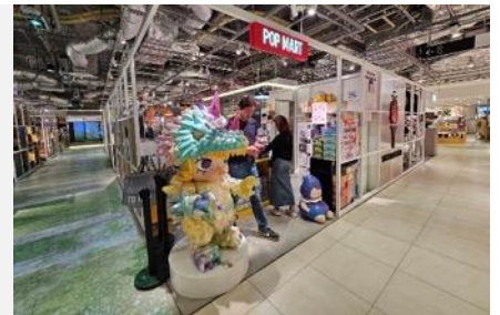
POP MART สายจุ่มถูกใจสิ่งนี้ !