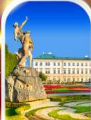
MIRABELL PALACE AUSTRIA