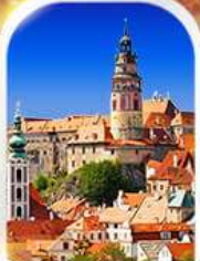
CESKY KRUMLOV CZECH