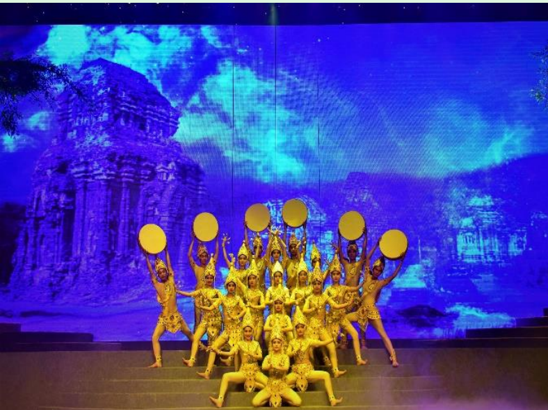
สัญลักษณ์ของสิริมงคล

จากนั้นเดินทางสู่ เมืองดานัง นำท่านชม เพื่อชมโชว์แสง สี เสียง (Charming Show) เป็นโชว์พื้นเมือง เช่น โชว์ภาพลวง ที่สื่อถึงภูเขาหมีเซิน สถานที่ลึกลับที่จะทำให้ผู้รับชมนึกถึงประวัติศาสตร์ ของชนพื้นเมือง Champa โชว์เสียงกลอง กลองที่ได้การรับการยกย่องว่าเป็นเครื่องรางที่สามารถสื่อสารกับสวรรค์ การตีกลองแต่ละครั้งเหมือนได้ยินเสียงเงิน คนเวียดนามเชื่อว่าเป็นเสียงที่สื่อ ถึงการนำพาโชคลาภมาให้แก่ครอบครัว โชว์การแสดงนกยูงรำแพนหาง คนเวียดนามเชื่อว่านกยูงเป็นสิ่งศักดิ์สิทธิ์ เป็นร่างทรงของฟีนิกซ์ มีขน ที่มีสีสันสวยงาม เป็น