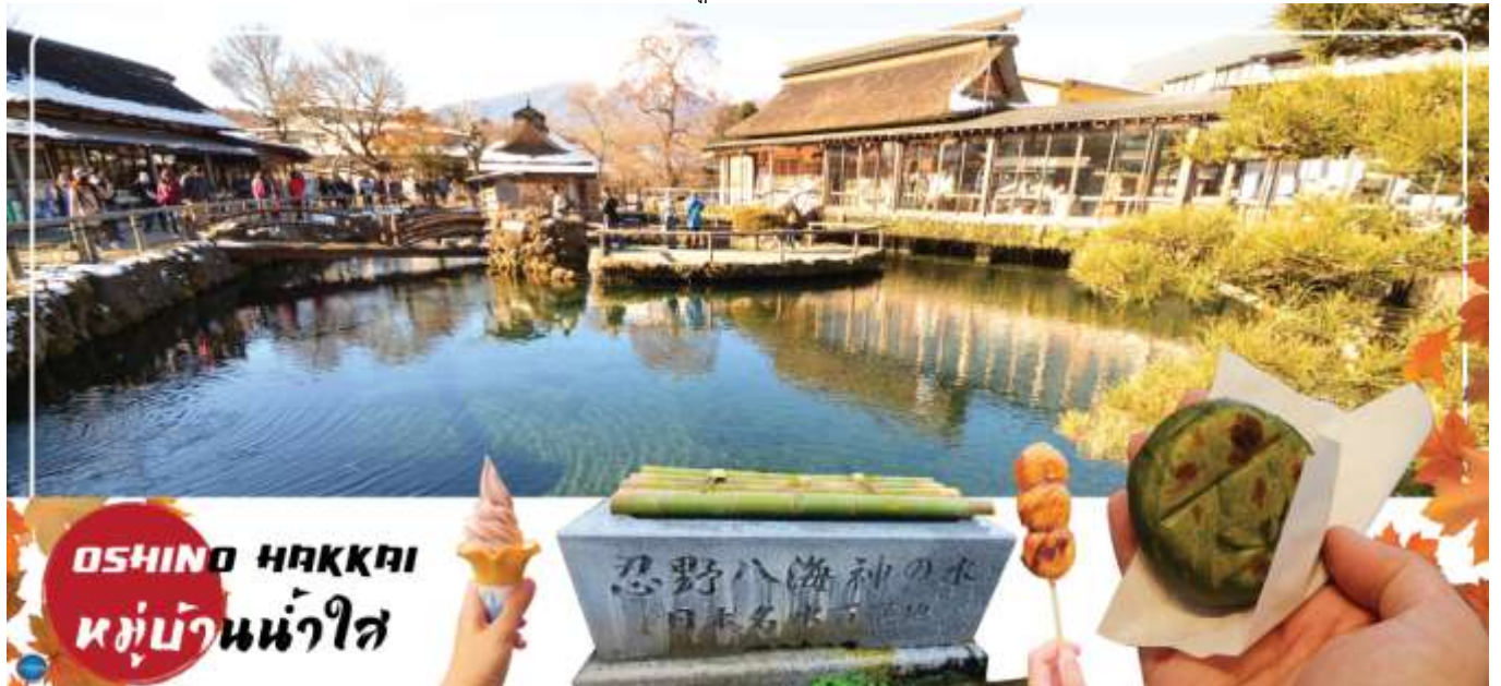
OSHINO HAKKAI หมู่บ้านน้ำใส

นำท่านชม หมู่บ้านโอชิโนะฮักไก (Oshino Hakkai) เป็นในช่วงฤดูใบไม้เปลี่ยนสีเป็นจุดท่องเที่ยวสำคัญอีกสถานที่หนึ่ง โดยมีวิวภูเขาไฟฟูจิสีขาวตัดกับพื้นหลังสีฟ้า และใบไม้เปลี่ยนสี สีเหลือง แดง ส้ม เป็นภาพที่สวยงามมาก โอชิโนะฮักไกเป็นหมู่บ้านเล็กๆ ประกอบด้วยบ่อน้ำ 8 บ่อในโอชิโนะฮักไก ตั้งอยู่ระหว่างทะเลสาบคาวากูจิโกะ กับทะเลสาบยามานาคาโกะ บ่อน้ำทั้ง 8 บ่อเป็นน้ำจากหิมะที่ละลายในช่วงฤดูร้อน ที่ไหลมาจากทางลาดใกล้ภูเขาไฟฟูจิผ่านหินลาวาที่มีรูพรุนอายุกว่า 80 ปี ทำให้น้ำใสสะอาดเป็นพิเศษ นอกจากนี้ยังมีร้านอาหาร ร้านจำหน่ายของที่ระลึก และขนมอร่อยๆ ที่ขายทั้งผัก ขนมหวาน ผักดอง งานฝีมือ และผลิตภัณฑ์ท้องถิ่นอื่นๆ อิสระให้ท่านได้เพลิดเพลินกับการถ่ายรูปและซื้อของที่ระลึกตามอัธยาศัย