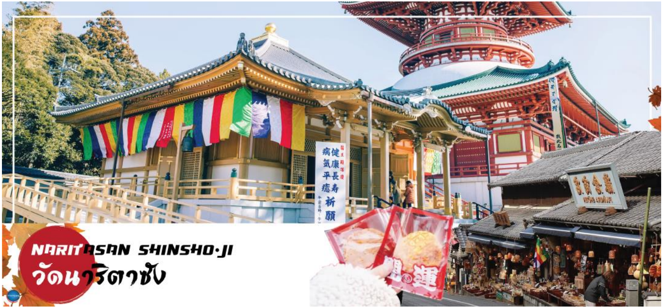
NARITASAN SHINSHO-JI วัดนาริตาซัง

วันที่สอง ท่าอากาศยานนานาชาตินาริตะ – เมืองนาริตะ – วัดนาริตะซัน – ถนนปลาไหล โอโมเตะซังโตะ – ย่านโอไดบะ – ห้างไดเวอร์ซิตี – เมืองนาริตะ