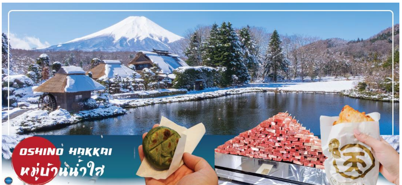
OSHINO HAKKAI หมู่บ้านน้ำใส

นำท่านชม หมู่บ้านโอชิโนะฮักไก (Oshino Hakkai) เป็นในช่วงฤดูใบไม้เปลี่ยนสีเป็นจุดท่องเที่ยวสำคัญอีกสถานที่หนึ่ง โดยมีวิวภูเขาไฟฟูจิสีขาวตัดกับพื้นหลังสีฟ้า และใบไม้เปลี่ยนสี สีเหลือง แดง ส้ม เป็นภาพที่สวยงามมาก โอชิโนะฮักไกเป็นหมู่บ้านเล็กๆ ประกอบด้วยบ่อน้ำ 8 บ่อในโอชิโนะ ตั้งอยู่ระหว่างทะเลสาบคาวากูจิโกะ กับทะเลสาบยามานาคาโกะ บ่อน้ำทั้ง 8 นี้เป็นน้ำจาก