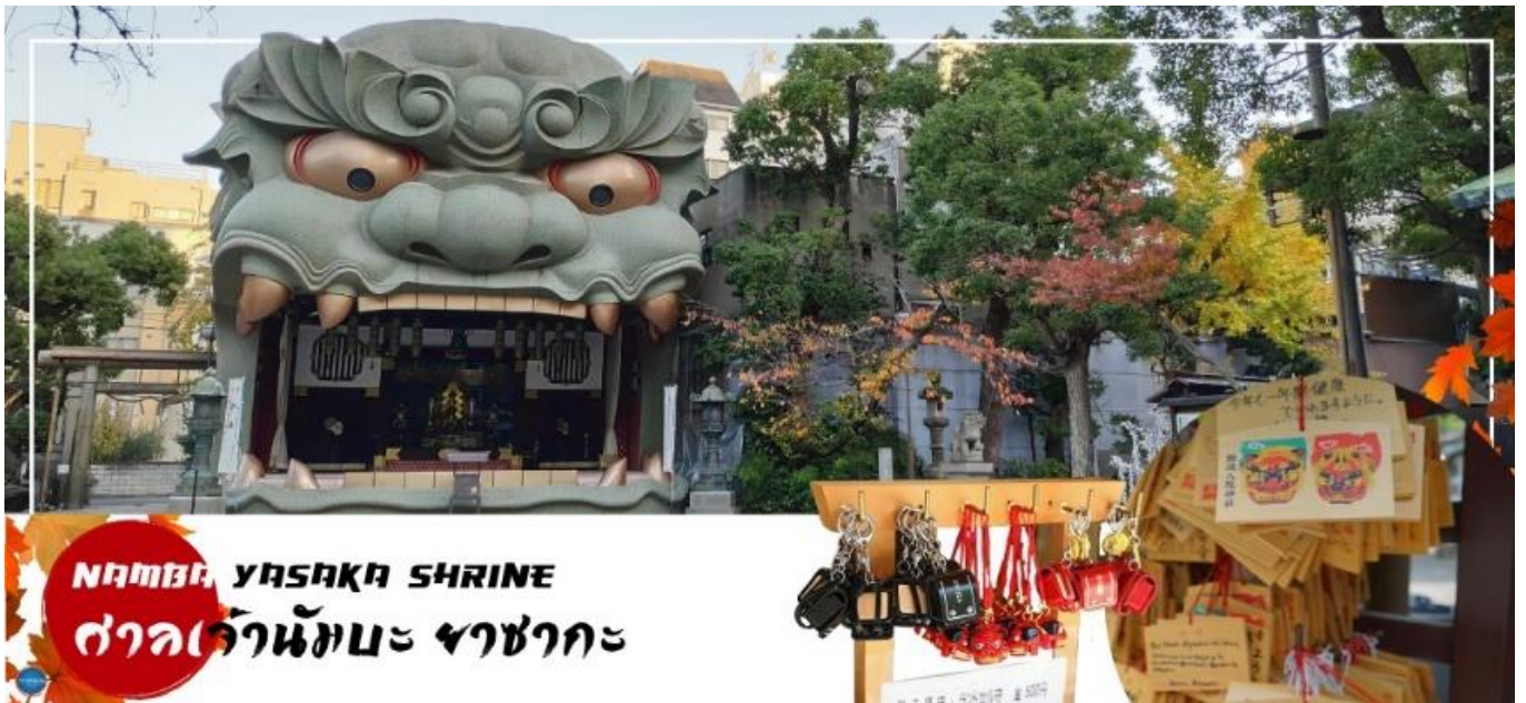
NAMBA YASAKA SHRINE

นำท่านสู่ ศาลเจ้าสุมิโยชิ (Sumiyoshi Taisha) เป็นหนึ่งในศาลเจ้าที่เก่าแก่ที่สุดของญี่ปุ่น สร้างขึ้นในศตวรรษที่ 3 มีสถาปัตยกรรมเฉพาะตัว เรียกว่า สุมิโยชิ-ซึคิริ (Sumiyoshi-Zukuri) ซึ่งไม่เหมือนกันรูปแบบศาลเจ้าของที่อื่น ๆ ในเอเชีย ศาลเจ้าสุมิโยชินี้เป็นศาลเจ้าหลัก และมีชื่อเสียงมากกว่าศาลเจ้าอื่น ๆ ในญี่ปุ่น ภายในนั้นจะเป็นที่ตั้งของเทพคามิ (เทพเจ้าชินโต) ซึ่งคอยให้ความคุ้มครองแก่นักเดินทาง ชาวประมงและชาวเรือ ดังนั้น เราจึงสามารถที่จะพบศาลเจ้ารูปแบบนี้ได้โดยมากที่บริเวณใกล้ท่าเรือ