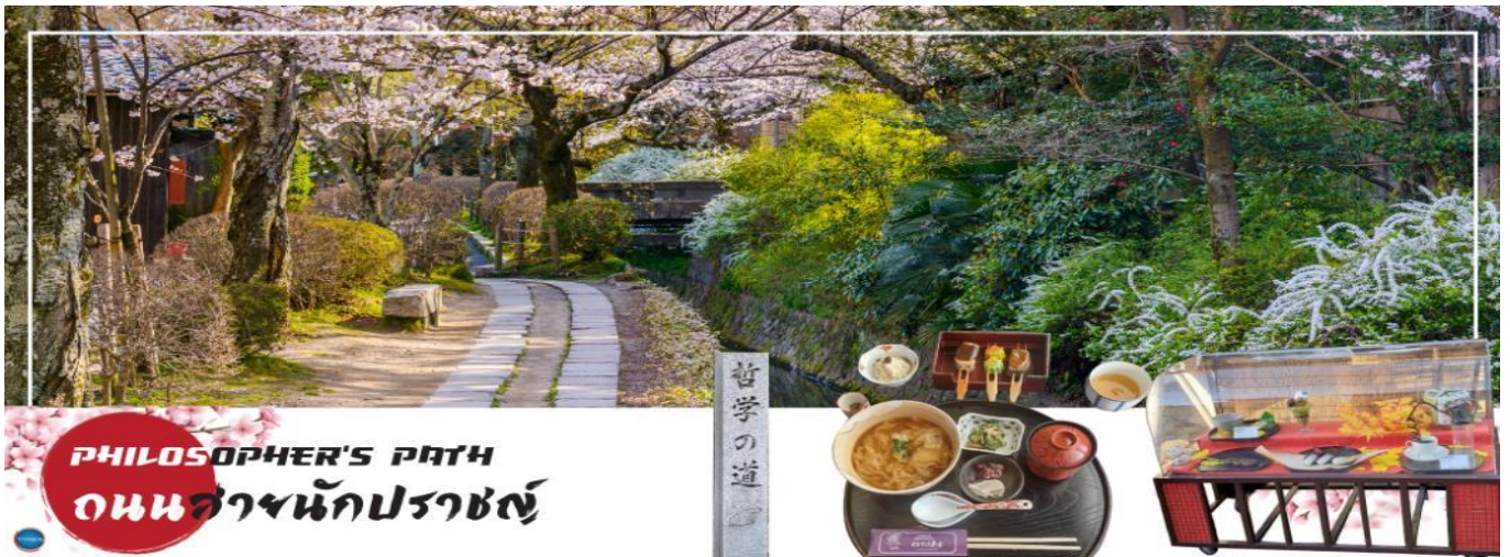
PHILOSOPHER'S PATH ถนนสายนักปราชญ์

บริเวณใกล้เคียงกันนำท่านเดินชม และช้อปปิ้ง ถนนสายนักปราชญ์ (Philosopher's Path) หรือ Tetsugaku no Michi เป็นถนนทางเดินเล็กๆ เลียบคลองส่งน้ำทะเลสาบบิวะ (Lake Biwa Canal (Biwako-sosui)) ตั้งอยู่ทางตะวันออกของเมืองเกียวโต (Kyoto) โดยเริ่มต้นตั้งแต่ใกล้ๆ กับวัดกินคะคุจิ (Ginkakuji Temple) ยาวมาจนถึงใกล้ๆ กับบริเวณวัดเอคันโด (Eikando Temple) และวัดนันเซ็นจิ (Nanzenji Temple) รวมเป็นระยะทางประมาณ 2 กิโลเมตร โดยตลอดเส้นทางนั้นก็เรียงรายไปด้วยต้นซากุระประมาณ 500 ต้น จึงเป็นจุดชมซากุระยอดนิยมในช่วงกลางเดือนมีนาคมถึงช่วงต้นเดือนเมษายน ( ขึ้นอยู่กับภูมิอากาศ ) และที่แห่งนี้ก็ยังมีร้านขายของและคาเฟ่น่ารักๆ กับน้องแมวที่อาจจะเผลอมาให้ท่านได้ถ่ายรูปอีกด้วย