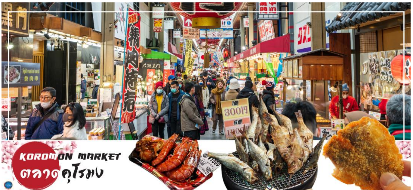
KUROMON MARKET ตลาดคุโรมง

จากนั้นนำท่านเดินทางสู่ ตลาดคุโรมง โอซาก้า (Kuromon Ichiba Market) เป็นตลาดที่มีชื่อเสียงและเก่าแก่ที่สุดแห่งหนึ่งของเมืองโอซาก้า บรรยากาศภายในเป็นทางเดิน Arcade เล็กๆ ทอดยาวประมาณ 600 เมตร 2 ข้างทางจะเต็มไปด้วยร้านค้าต่างๆกว่า 160 ร้านค้าขายทั้งของสด และแบบพร้อมทาน มีของกินเล่นและอาหารพื้นเมืองมากมายชนิดให้ได้ชิมกัน