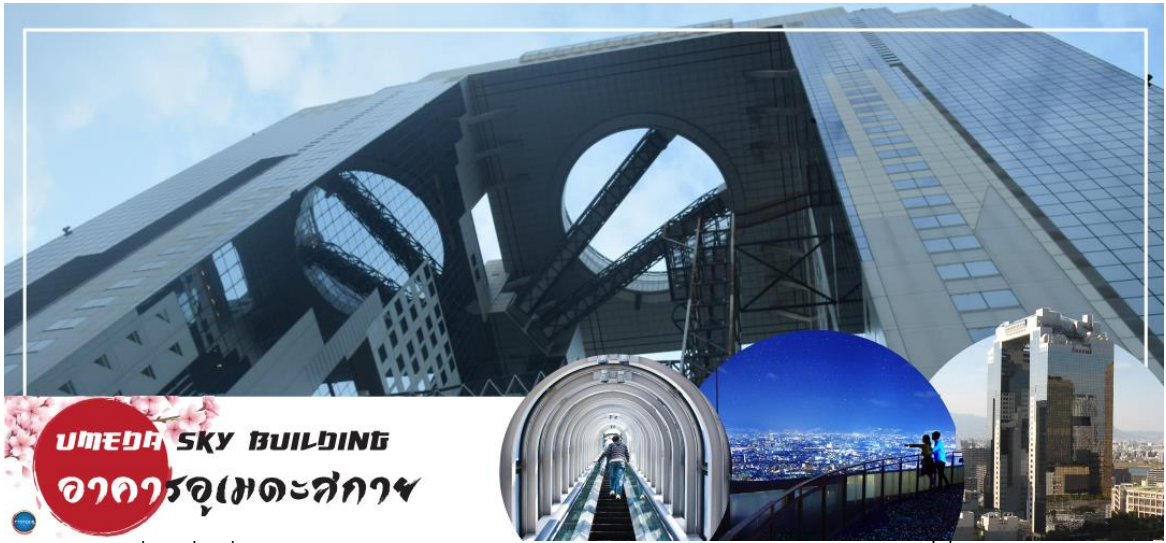
UMEDA SKY BUILDING อาคารอุเมดะสกาย

จากนั้นนำท่านสู่ จุดชมวิวดาการอุเมดะสกาย (Umeda Sky Building) (ใช้เวลาเดินทางประมาณ 20 นาที) เป็นสถาปัตยกรรมอาคารสูงที่งดงามในย่านคิตะของโอซาก้า อีกทั้งยังเป็นจุดชม