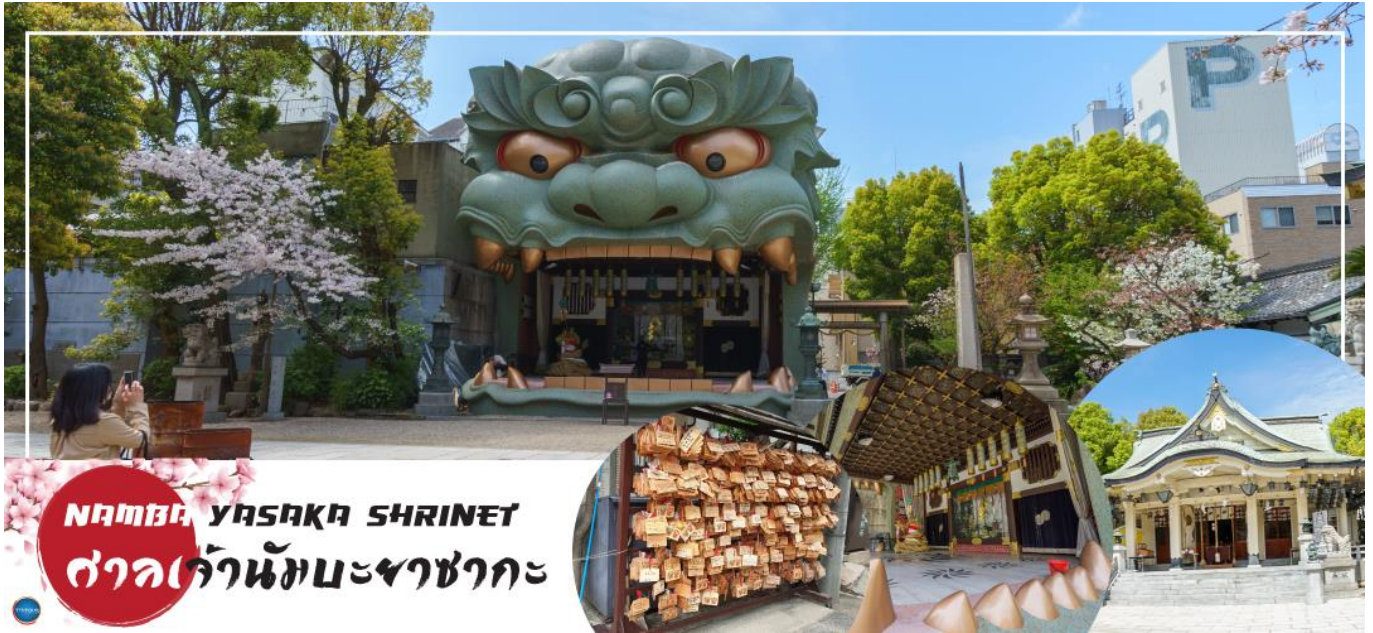
NAMBA YASAKA SHRINE ศาลเจ้านัมบะยาซากะ

วันที่ห้า เมืองโอซาก้า – ศาลเจ้านัมบะยาซากะ – ตลาดคุโรมง – ห้างอ็อน มอลล์ รังกุเซนน – ท่าอากาศยานนานาชาติคันไซ – ท่าอากาศยานนานาชาติดอนเมือง