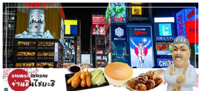
SHINSAIBASHI ย่านชินไซบาชิ

อิสระช้อปปิ้ง ย่านชินไซบาชิ (Shinsaibashi) บริเวณแหล่งช้อปปิ้งแห่งนี้มีความยาวประมาณ 600 เมตร เต็มไปด้วยร้านค้าปลีก ร้านแฟชั่นร้านเครื่องสำอางค์ ร้านรองเท้า กระเป๋า นาฬิกา ร้านกาแฟ ร้านอาหาร ร้านขนม ร้านเสื้อผ้าสตรีทแบรนด์ทั้งญี่ปุ่นและต่างประเทศ เช่น Zara H&M Beans ABC Mart เป็นต้น เรียกว่ามีทุกอย่างที่ต้องการรวมกันอยู่บริเวณนี้ ใกล้กันท่านสามารถเดินไปยัง ย่านโดทงโบริ (Dotonbori) ย่านบันเทิงยามค่ำ คินดอลอดแนวถนนเลียบบคลองโดทงโบริ