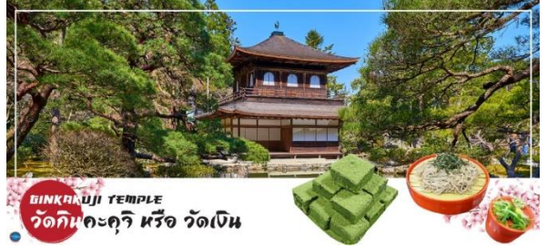
GINKAKUJI TEMPLE วัดกินคะคุจิ หรือ วัดเงิน

ทะเบียนกับองค์การยูเนสโกให้เป็นมรดกโลกด้านวัฒนธรรม ซึ่งวัดกินคะคุจิเป็นวัดนิกายเซน ถูกสร้างขึ้นโดยโชกุนอชิคากะ โยชิมาสะ หลานชายของท่านโชกุน ที่สร้างวัดกินคะคุจิ (Kinkakuji Temple) หรือที่รู้จักกันอย่างกว้างขวางว่าวัดทองสำหรับอาคารของวัดเงิน สร้างขึ้นในรูปแบบเดียวกัน เพียงแต่จะไม่ได้มีสีทอง เป็นอาคาร 2 ชั้น และมีกฟีนิกซ์อยู่บนหลังคา อาคารเช่นเดียวกัน อาณาบริเวณของวัดซึ่งอยู่บนเขายังคงสภาพความเป็นธรรมชาติป่าอย่างสมบูรณ์แบบ มีต้นไม้จำนวนมาก ในแบบสวนญี่ปุ่น เต็มไปด้วยความชุ่มชื้นเย็นสบาย