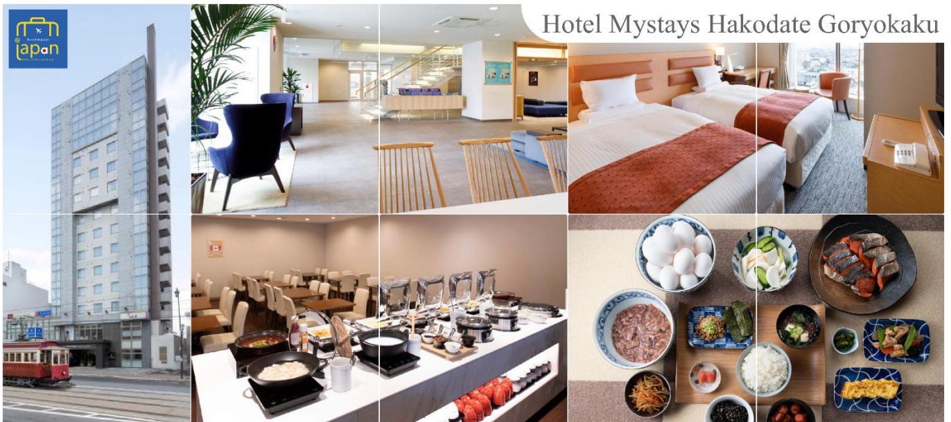
Hotel Mystays Hakodate Goryokaku

ที่พัก HOTEL MYSTAYS HAKODATE GORYOKAKU, HAKODATE หรือเทียบเท่าระดับเดียวกัน