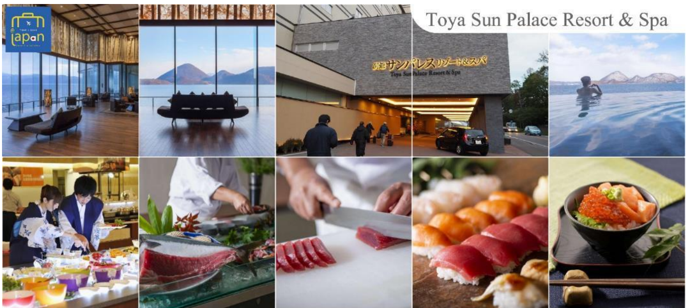
Toya Sun Palace Resort & Spa

--หลังอาหารให้ท่านได้ผ่อนคลายกับการแช่น้ำแร่ธรรมชาติ เชื่อว่าถ้าได้แช่น้ำแร่แล้ว จะทำให้ผิวพรรณสวยงามและช่วยให้ระบบหมุนเวียนโลหิตดีขึ้น--