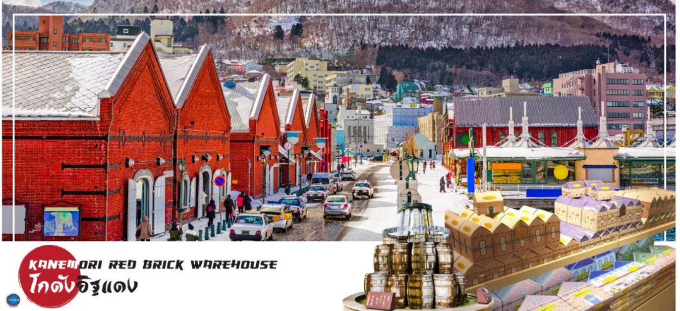
KANEMORI RED BRICK WAREHOUSE โกดังอิฐแดง

เมืองฮาโกดาเตะ – ตลาดเช้าฮาโกดาเตะ – โกดังอิฐแดง – ย่านเมืองเก่าโมโตมาชิ – ป้อมโกเรียวกาคู (เช้าชม) – ทะเลสาบโทยะ – ออนเซน