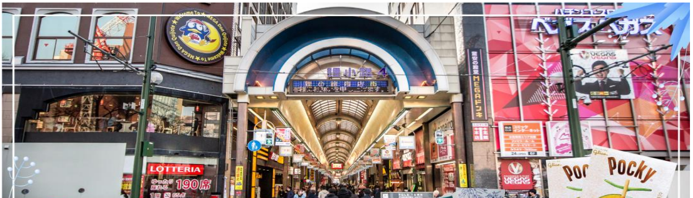
TANUKI KOJI ย่านทานุกิโคจิ

และให้ท่านเดินเล่น ณ ถนนช้อปปิ้งทานุกิโคจิ (Tanukikoji Shopping Street) เป็นย่านการค้าเก่าแก่ของเมืองซัปโปโร โดยมีพื้นที่ทั้งหมด 7 บล็อก ภายในนอกจากจะเป็นแหล่งรวมร้านค้าต่างๆ อย่างร้านขายกิโมโน เครื่องดนตรี วิดีโอ โรงภาพยนตร์แล้ว ยังมีร้านอาหารมากมาย ทั้งยังเป็นศูนย์รวมของเหล่าวัยรุ่นด้วย เนื่องจากมีเกมเซนต์เตอร์ และตู้หนีบตุ๊กตามากมาย ร้านดองกิ ร้าน 100 เยน นอกจากนั้นที่นี่ยังมีการตกแต่งบนหลังคาด้วยตุ๊กตาทานุกิขนาดใหญ่ และเนื่องจากร้านค้าส่วนใหญ่มีหลังคาคลุม ดังนั้น ไม่ต้องกังวลเรื่อง ฝนหรือหิมะ ท่านสามารถช้อปปิ้งได้อย่างเพลิดเพลิน