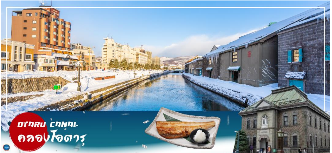
OTARU CANAL คลองโอตารุ

ขนมแล้วยังเป็นร้านกาแฟ ที่หากท่านเดินช้อปปิ้งมาเหนื่อยๆ สามารถแวะมาพักผ่อนจิบเครื่องดื่มพร้อมชิมขนมหวาน ณ ร้านนี้ได้ ร้านนี้คือ ร้าน Rokkatei โกดัง โรงงานผลิตขนมของฮอกไกโด ด้านในมีจำหน่ายขนมมมเนย รวมไปถึง กาแฟ และของฝากของขึ้นชื่อของเมืองโอตารุ อีกทั้งสามารถซื้อสินค้าแบบ Tax Free ได้ด้วย และข้างๆกันยังมี ร้าน Kitakaro โกดังผลิตขนมอีกรายหนึ่ง ร้านนี้เน้น