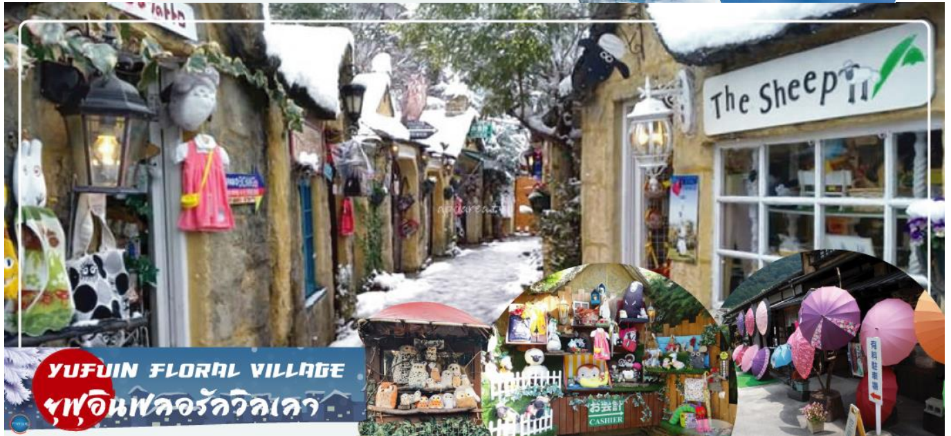
YUFUIN FLORAL VILLAGE หมู่บ้านฟลอรัลวิลเลจ