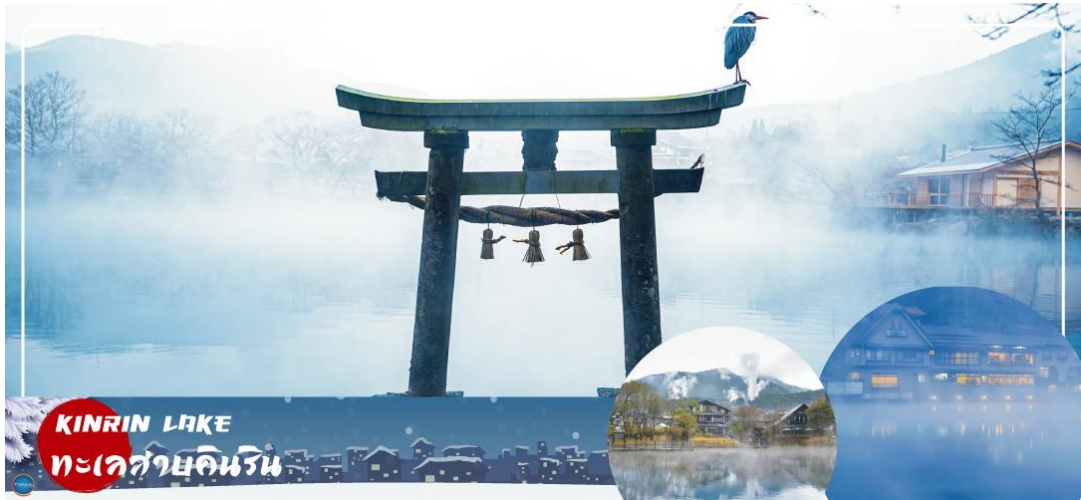
KINRIN LAKE ทะเลสาบคินริน