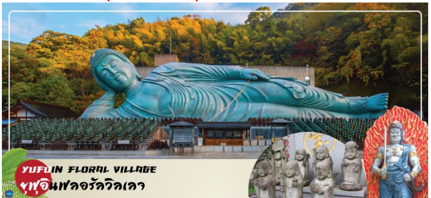
YUFUIN FLORAL VILLAGE หมู่บ้านฟลอรัลวิลเลจ

เลือกรับประทานอาหารกลางวัน ณ หมู่บ้านยูฟุอินตามอัตราค่า (3) Cash Back ท่านละ 1000 เยน (จ่ายโดยไกด์หน้างาน)