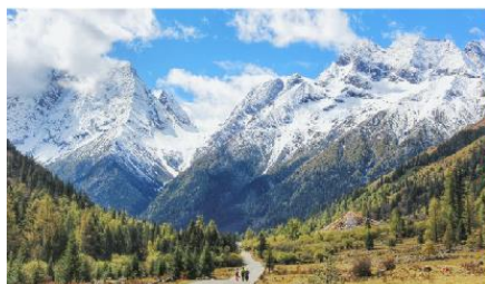
กุเขาสีดรุณี