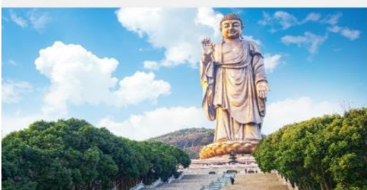
พระใหญ่หลังซานต้าฝอ