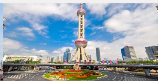
วงเวียนหมิงจู่