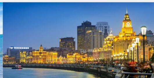
หาดไว่ถาน