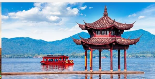
ล่องเรือชมทะเลสาบซีหู