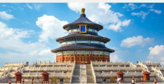
หอบูชาฟ้าเทียนถาน