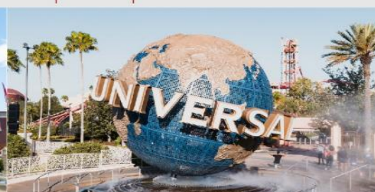
ยูนิเวอร์เซล ปักกิ่ง รีสอร์ท