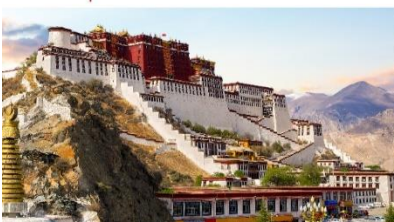
พระราชวังโปตาลา