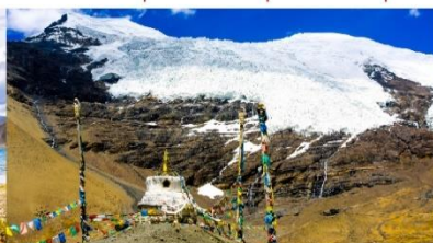
ราน้ำแข็งคาโนลา