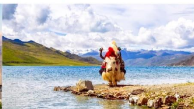
ทะเลสาบยัมดรก