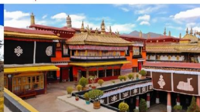
วัดโจคัง