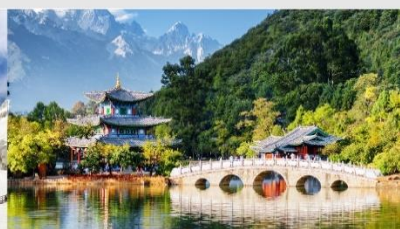
สระมิงกรดำ