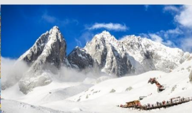
ภูเขาหิมะมิงกรหยก