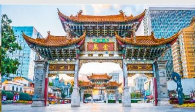
ประตูม้าทอง โก่หยก