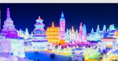
เทศกาลโคมไฟน้ำแข็ง