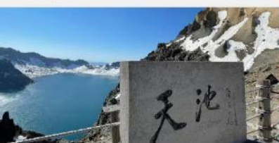
อุทยานฉางไป่ซาน