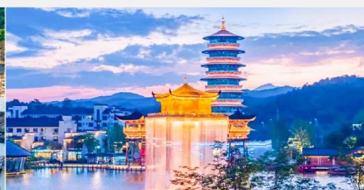
หุบเขาเทวดาฉางเซียงหนู่