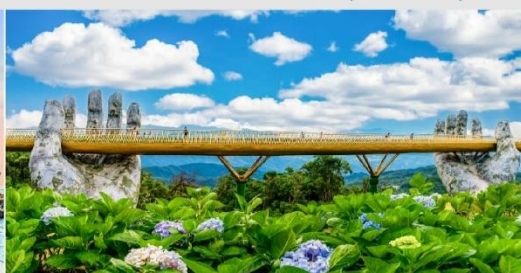
สะพานโกเด็นบริดจ์