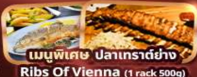
เมนูพิเศษ ปลาเทราต์ย่าง Ribs Of Vienna (1 rack 500g)