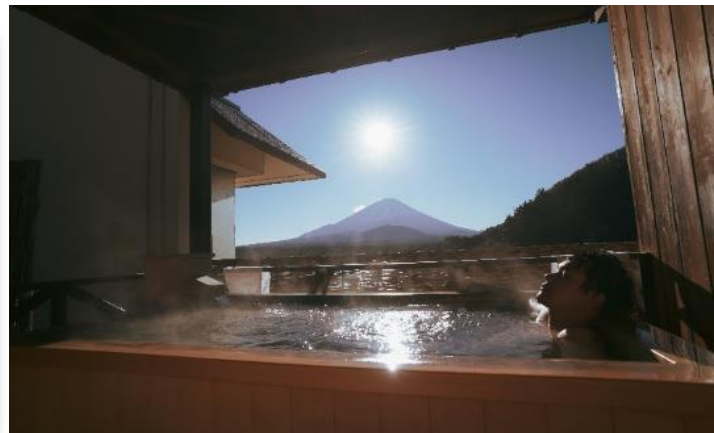
ที่พัก: Fujisan Garden Hotel 3* หรือระดับ

Highlight! หลังมื้ออาหาร ไม่ควรพลาดประสบการณ์ สัมผัสวัฒนธรรม การอาบน้ำแร่ออนเซ็น (Onsen) น้ำแร่ในสไตลญี่ปุ่น ให้ท่านได้พักผ่อนอย่างเต็มอิ่ม ซึ่งชาวญี่ปุ่นเชื่อว่าน้ำแร่ธรรมชาติมีส่วนช่วยเรื่อง ระบบการหมุนเวียนของเลือดดีขึ้น การบรรเทาอาการปวดเมื่อยต่างๆ และช่วยผ่อนคลายความตึงเครียด อาการเหนื่อยล้าได้อย่างดี พร้อมทั้งบำรุงผิวพรรณให้เปล่งปลั่ง