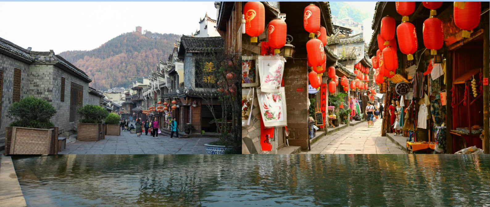
พื้นเมือง

Highlight! สายกินไม่ควรพลาด ที่มี คือเมืองเก่าแก่ จึงมีอาหารพื้นเมืองต้น ตำหรับมากมาย ควรค่าแก่การได้ลองชิม