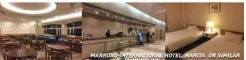
MARROAD-INTERNATIONAL HOTEL, NARITA OR SIMILAR