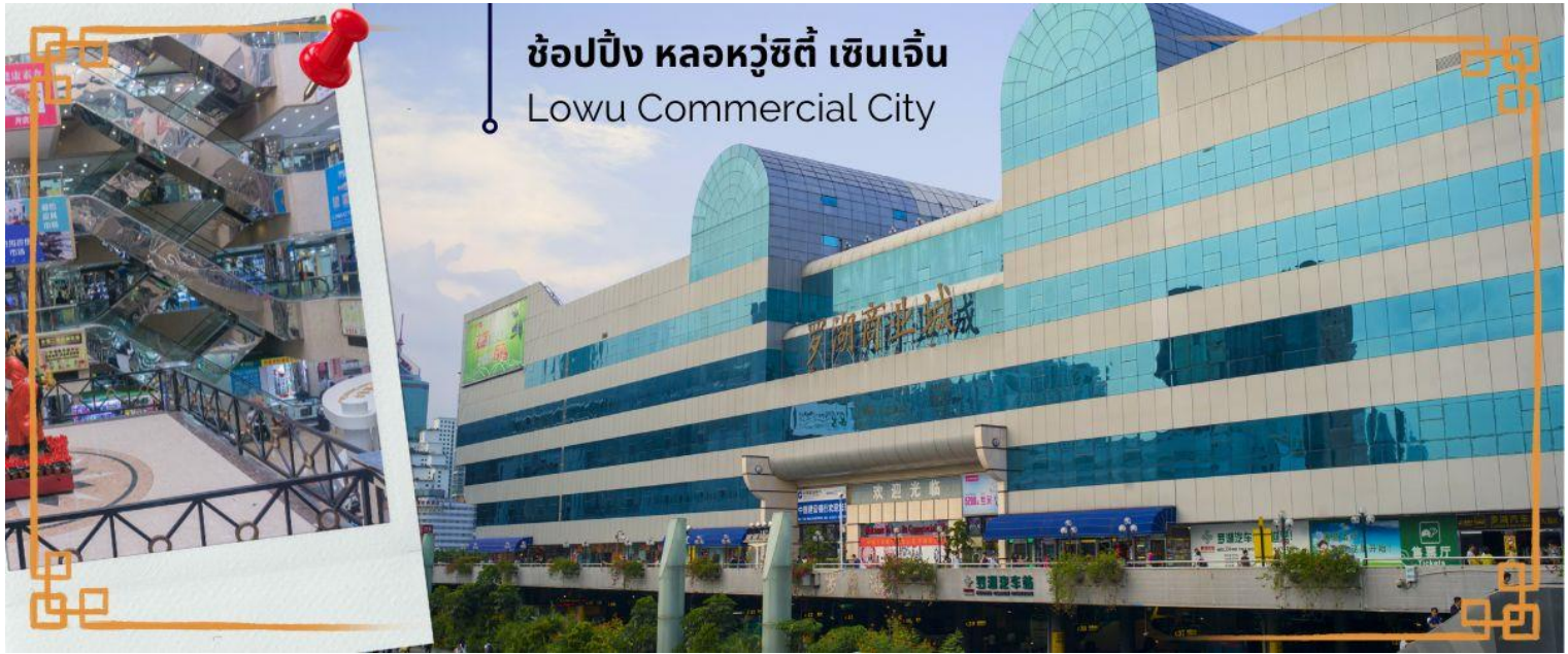
ช้อปปิ้ง หลอหวู่ชิตี้ เซินเจิ้น Lowu Commercial City

จากนั้นนำท่านอิสระช้อปปิ้ง หลอหวู่ชิตี้ เซินเจิ้น หลอหวู่ชิตี้คือแหล่งช้อปปิ้งชื่อดังของเมืองเซินเจิ้น ที่มีสินค้าพื้นเมืองและสินค้าเลียนแบบแบรนด์เนมมากมายหลายชนิดหลากยี่ห้อ ให้ท่านได้เลือกซื้อในราคาไม่แพง ทั้งกระเป๋า รองเท้า นาฬิกา เครื่องใช้ไฟฟ้า ปากกา เครื่องประดับ อุปกรณ์อิเล็กทรอนิกส์ต่างๆ ซึ่งนักท่องเที่ยวที่มาช้อปปิ้งที่นี่สามารถต่อรองราคาได้มากถึง 50% จากราคาที่ถูกตั้งไว้ในตอนแรก และพ่อค้าแม่ค้าคนจีน ณ ตลาดแห่งนี้สามารถพูดภาษาไทยได้พอสมควร