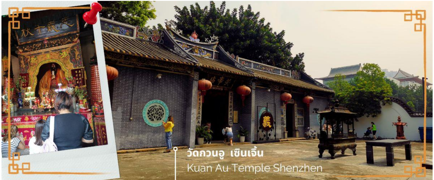
วัดกวนอู เซินเจิ้น Kuan Au Temple Shenzhen

จากนั้นนำท่านเดินทางสู่ วัดกวนอู ไหว้เทพเจ้ากวนอู สัญลักษณ์ของความซื่อสัตย์ ความกตัญญูรู้คุณ ความจงรักภักดี ความกล้าหาญ โขดลาง และบารมี ท่านเปรียบเสมือนตัวแทนของความเข้มแข็งเด็ดเดี่ยวของอาจไม่ครั้นคร้ามต่อศัตรู ท่านเป็นคนจิตใจมั่นคงตั้งขุนเขา มีสติปัญญาเฉลียวฉลาด และไม่เคยประมาทการบูชาขอพรท่านก็หมายถึงขอให้ท่านช่วยอุดช่องว่างไม่ให้เพลิงพลัง้าแก่ฝ่ายตรงข้าม และให้เกิดความสมบูรณ์ด้วยคนข้างเคียงที่ซื่อสัตย์ หรือบริวารที่ไวใจได้นั้นเองดังนั้นประชาชนคนจีนจึงนิยมบูชา และกราบไหว้เพื่อความเป็นสิริมงคลต่อตนเอง และครอบครัวในทุกๆ ด้าน