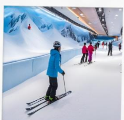
บ้านหิมะ WINDOW OF THE WORLD