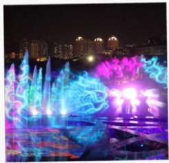
โชว์ม่านน้ำสามมิติ OCT BAY WATER SHOW