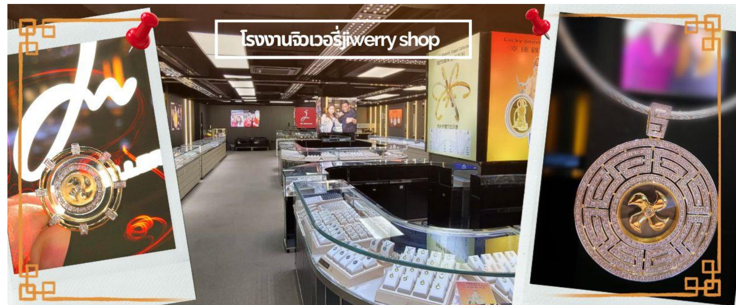
โรงงานจิวเวอรี่ jewelry shop

จากนั้นนำท่านชม โรงงานจิวเวอรี่ ซึ่งเป็นโรงงานที่มีชื่อเสียงที่สุดของฮ่องกงในเรื่องการออกแบบเครื่องประดับ อาทิเช่น จี้ และแหวนกำหั้น ที่สวยงามโดดเด่นไม่เหมือนใคร ซึ่งถือกำเนิดขึ้นที่นี่และมีชื่อเสียงที่สุดใช้เป็นเครื่องประดับติดตัว และเสริมดวงชะตา สินค้าทุกชิ้นมีเอกสารรับประกันคุณภาพเปลี่ยน ซ่อม ได้ตลอดอายุการใช้งาน หากเกิดการชำรุดจากสินค้าไม่ใช่อุบัติเหตุ