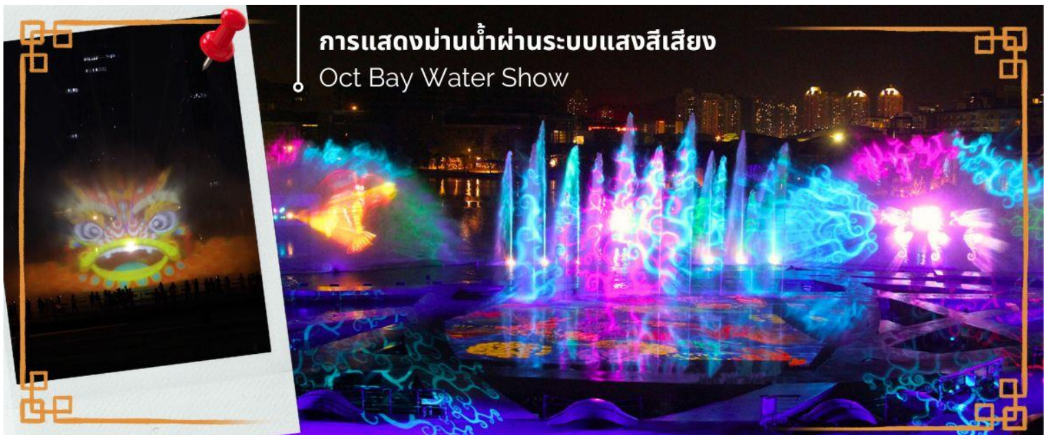
การแสดงม่านน้ำผ่านระบบแสงสีเสียง Oct Bay Water Show

จากนั้นนำท่าน ชมการแสดงม่านน้ำผ่านระบบแสงสีเสียง OCT BAY WATER SHOW เป็นโชว์ม่านน้ำแบบ 3 มิติ ที่ใช้ทุนสร้างกว่า 200 ล้านบาท จัดแสดงที่ OCT BAY Water Show Theatre Shenzhen ซึ่งเป็นโรงละครทางน้ำขนาดใหญ่ที่สามารถจุได้ถึง 2,595 คน เป็นโชว์ที่เกี่ยวกับเด็กหญิงผู้กล้ากับสิ่งวิเศษที่ออกตามหาเครื่องบรรเลงเพลงที่มีชื่อว่าปีกแห่งความรัก เพื่อเอามาช่วยนกที่ถูกทำลายจากมนต์ (มลพิษ) ในป่าโกงกาง การแสดงใช้อุปกรณ์ เช่น แสงเลเซอร์ ไฟ เครื่องเปล่งแสง ม่านน้ำ ระเบิดน้ำ กว่า 600 ชนิด เป็นโชว์น้ำที่ใหญ่และทันสมัยที่สุดในโลก