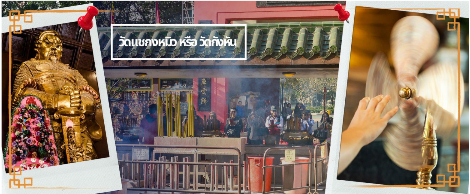
วัดเขกงหมือ หรือ วัดกังหัน

จากนั้นนำท่านเดินทางสู่ ย่านมงก๊ก เป็นย่านที่มีความคึกคักที่สุดแห่งหนึ่งในเกาะฮ่องกงก็ว่าได้ เป็นสวรรค์ของนักช้อปปิ้งหนึ่งที่ สายช้อปปะพลาดไม่ได้ นับได้ว่าเป็นย่านช้อปปิ้งที่คึกคักมากอีกแห่งหนึ่งของฮ่องกง เพราะเป็นย่านช้อปปิ้งที่มีทั้งร้านค้า และคนที่มาช้อปปิ้งจากที่ต่างๆ มากมายไม่ขาดสายตั้งแต่กลางวันยันกลางคืน เป็นถนนช้อปปิ้งที่มีสีสันมาก ถ้าเทียบกับญี่ปุ่นแล้วก็เปรียบเหมือนการเดินอยู่ที่ชิบูย่าเลยก็ว่าได้ และยังมีทั้ง