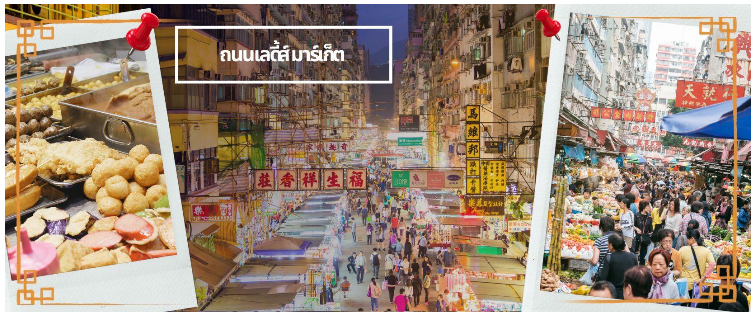
ถนนเลดี้มาร์เก็ต

เครื่องสำอาง เสื้อผ้า รองเท้า กระเป๋า เครื่องประดับมากมายให้เลือกช้อป อีกทั้งยังมีร้านอาหารและเครื่องดื่ม ที่ขึ้นชื่อหลากหลายชนิด ให้ทุกท่านได้ลองลิ้มรสอีกมากมาย