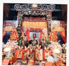
วัดกวนไท่