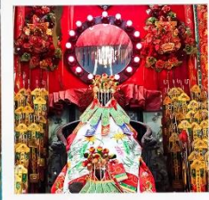
เจ้าแม่กวนอิมสองอ้า