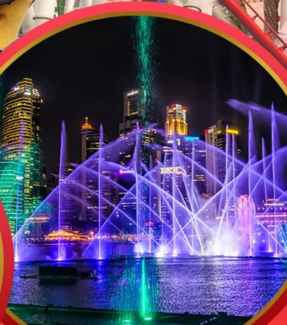
Light & Water Show