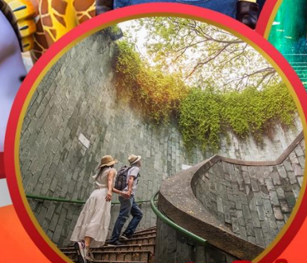
Fort Canning Park